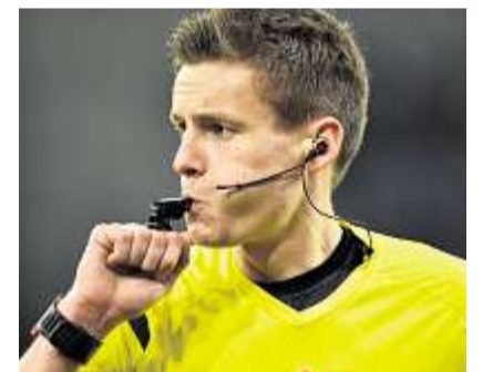
Mancher Pfiff des Schiedsrichters sorgt hernach für Diskussionen.