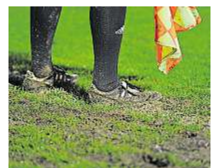
Wer an der Linie als Assistent steht, muss so einiges abkönnen.