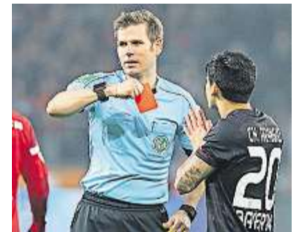
Unparteiische müssen in Sekundenschnelle Entscheidungen treffen.