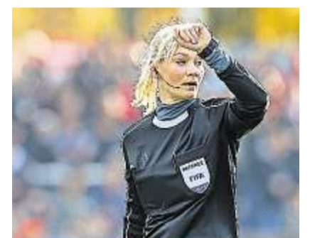
Auch Schiedsrichterinnen werden in Neumarkt gesucht.